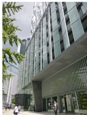
大名古屋ビルヂング